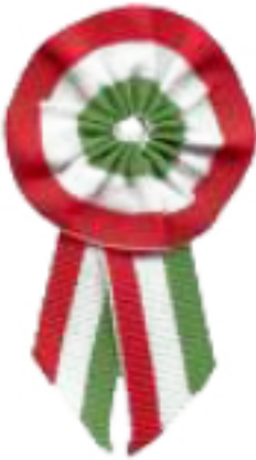
Helytelen de szebb